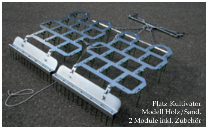
Platz-Kultivator Modell Holz/Sand, 2 Module inkl. Zubehör

7016-1235595-004-4 4:4c,re.S.ob-eck-Txt-2-m.Anz.# Reitsportanlagen # Reitplatz-Innovationen